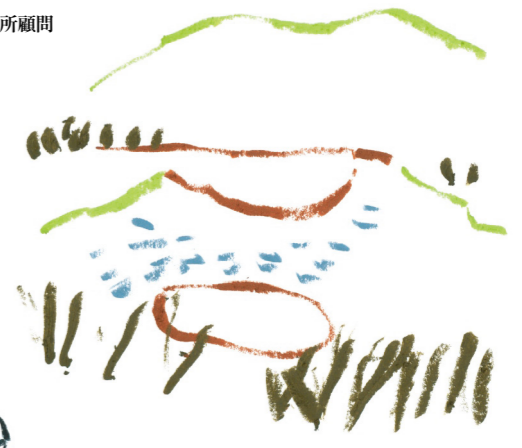
表紙イラスト◎北村人